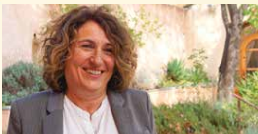
Werving van studenten