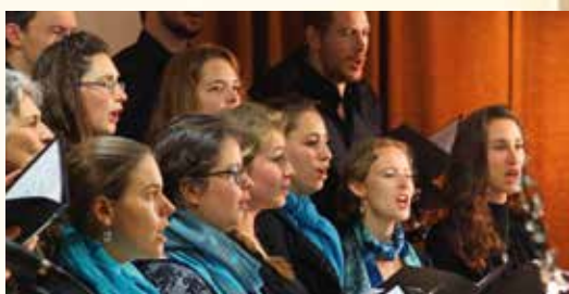
Koor faculté Jean Calvin